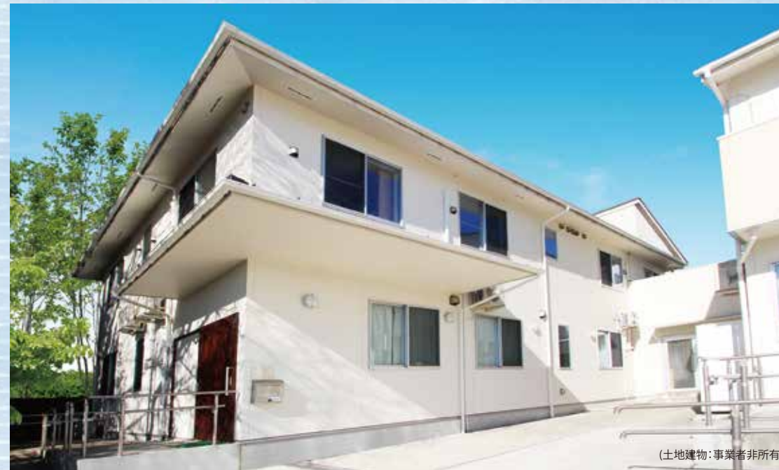
(土地建物：事業者非所有)